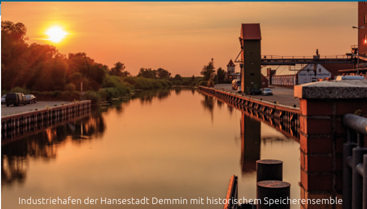
Industriehafen der Hansestadt Demmin mit historischem Speicherensemble