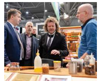
Beratung & Dienstleistung