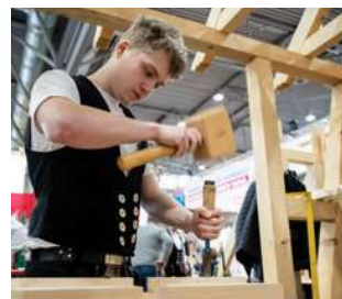
Bau & Ausbau

Im Fokus 2026: Schule trifft Handwerk Anpacken, Ausprobieren, Orientieren Schülertage: 03. – 05.02.2026