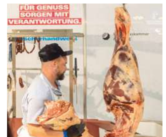
Nahrung & Genuss