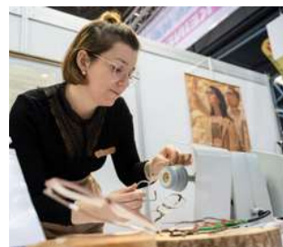
Kunsthandwerk & Design