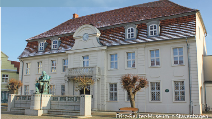
Fritz-Reuter-Museum in Stavenhagen